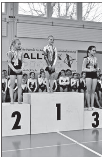
Das Podest der Kategorie 2.